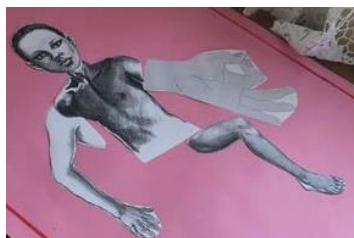
幼稚園にあった、身体のパーツ を英語で覚えるための教材