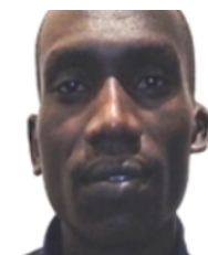
🇺🇬 ジョシュア・チェ ブテゲイ