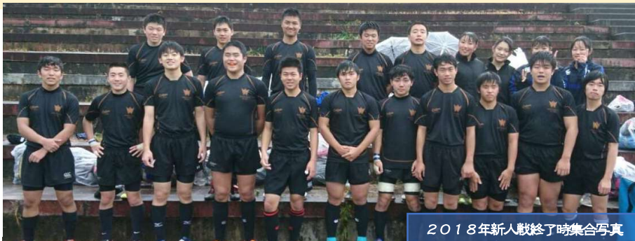
2018年新人戦終了時集合写真

Bブロック1回戦 ●盛北7-22合同A (不来方・盛南・花東) 順位決定戦 ○盛北86-7合同B (宮工・大船渡東)