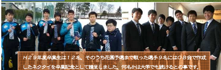
H29年度卒業生は12名。そのうち花園予選まで戦った選手9名にはOB会で作成したネクタイを卒業記念として贈呈しました。何名かは大学でも続けるとの事です。