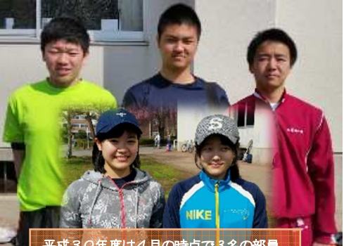
平成30年度は4月の時点で3名の部員と2名のマネージャーが入部しました！

8/11(土)午前：OB戦(盛岡北高C) 夕方：総会・懇親会(三寿司本店予定) 8/15(水)午前：一三北高OB定期戦(いわぎんスタジアム) 夕方：一三北高OB合同懇親会(桜山神社) ※今回は盛北OBがホスト校となり、準備が必要な為、多数の参加をお願いします。