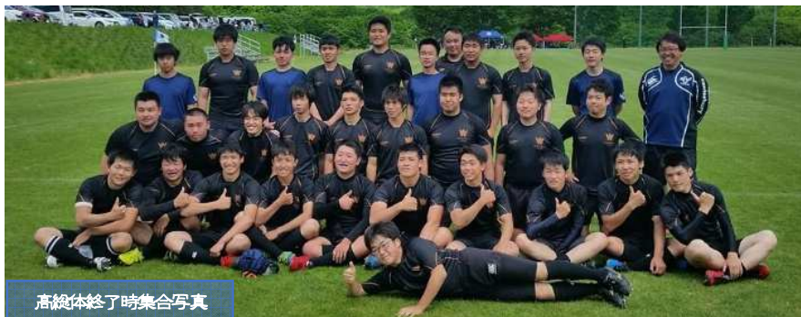
高総体終了時集合写真